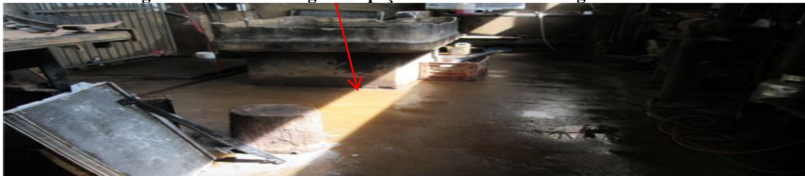
Figura 3: Local de lavagem de peças com óleo no chão e água contaminada

O piso da oficina é apenas em chão “bruto”, por não possuir impermeabilização pode contaminar o solo, pois se cair óleo ou produtos químicos não há nada que impeça de passar pelo piso e atingir o solo. Na Figura 3 é possível visualizar gotas de óleo e grande quantidade de produto químico para limpeza dos radiadores misturado com água no chão.