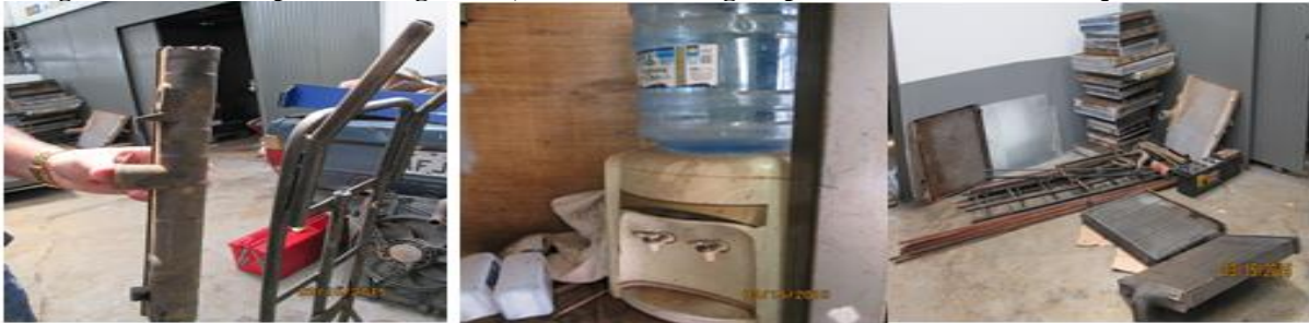
Figura 2: A direita plástico do gerador, ao meio embalagens plásticas de fluídos e a esquerda metais