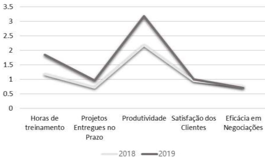
Figura 3 – Evolução dos indicadores financeiros