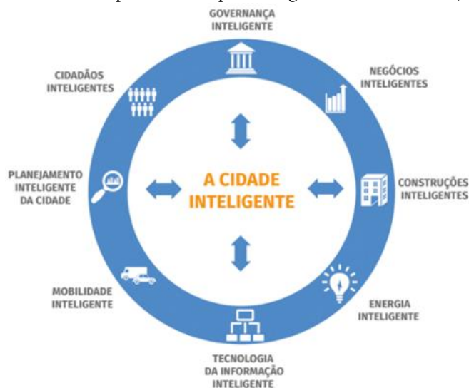
Figura 1 - Smart Cities of the future in Asia: The opportunities for UK business. (Cidades Inteligentes do Futuro na Ásia: As oportunidades para o negócio no Reino Unido)