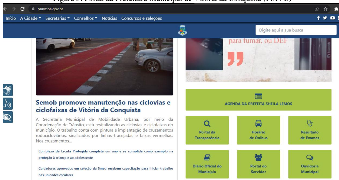
Figura 3: Portal da Prefeitura Municipal de Vitória da Conquista (PMVC)