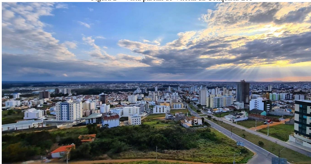
Figura 2 – Vista parcial de Vitória da Conquista-BA

Em termos demográficos, segundo dados do Censo 2010 realizado pelo IBGE (2010), Vitória da Conquista (FIGURA 2) contava com cerca de 310 mil habitantes e, conta, atualmente com 343.643 mil habitantes estimados no ano de 2021, em um estado com população acima de 15 milhões. O município tem uma ótima ocupação, sendo sua densidade demográfica de 91,41 hab/km 2 , enquanto no estado da Bahia é de 24,82 hab/km 2 . Em termos gerais, configura-se como a terceira mais populosa cidade do estado (IBGE, 2022).